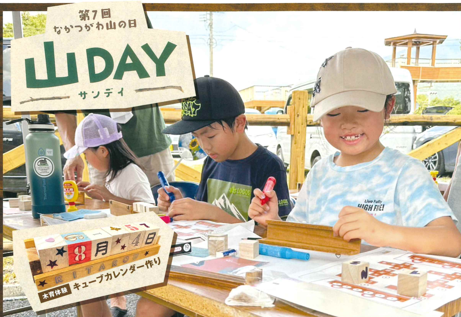
令和6年8月4日に付知町で開催された「山の日イベント・山DAY」。当組合は、「キューブカレンダー作り」のブースを出しました。